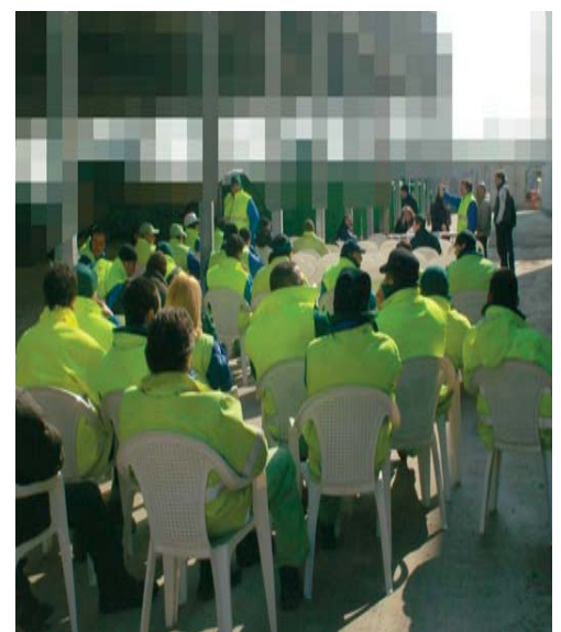
Muggiano, assemblea CGIL 08/03/2010